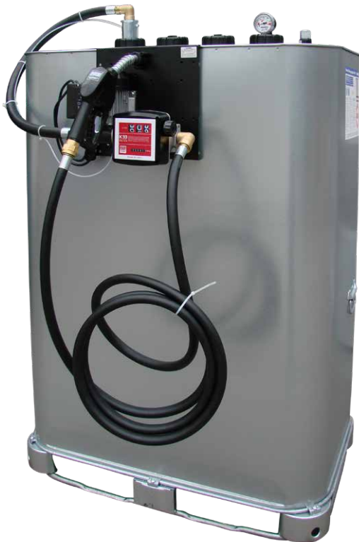
Kleintankanlage E 56-BS/Z

zur Befestigung von Pumpe und Schlauchhaspel auf dem Tank; kann auf alle gängigen Tankmodelle montiert werden.