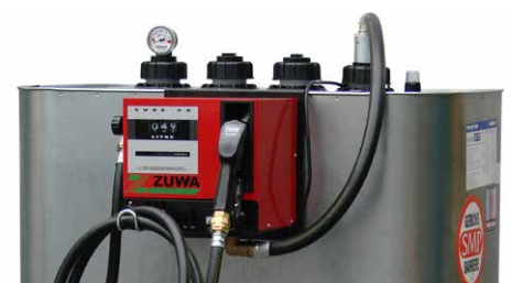
Kleintankanlage KT 50