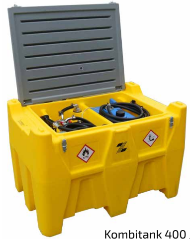
Kombitank 400 / 50