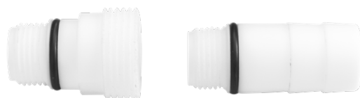
Anschluss 3/4" aG