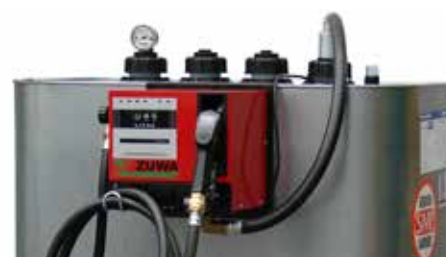
Kleintankanlage KT 50