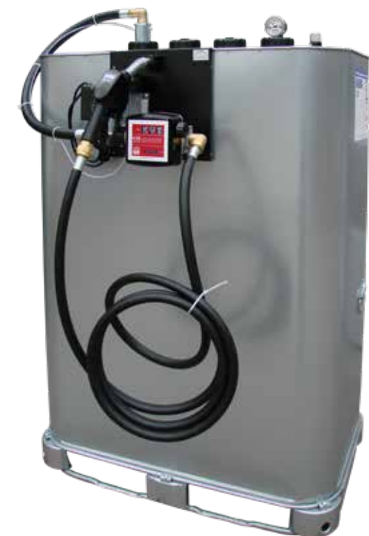
Kleintankanlage E 56-BS/Z

zur Befestigung von Pumpe und Schlauchhaspel auf dem Tank; kann auf alle gängigen Tankmodelle montiert werden.