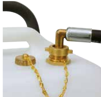
Rücklauf Anschluss im 90°-Winkel