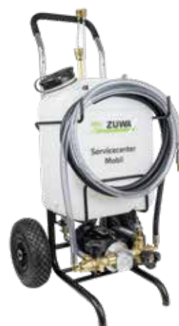
Servicecenter Mobil KOMPAKT