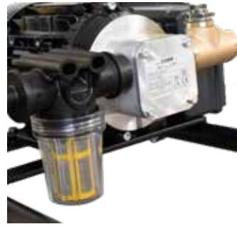
Pumpe mit Filter