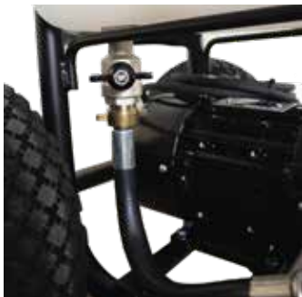
Absperrhahn aus Metall, stoßsicher positioniert