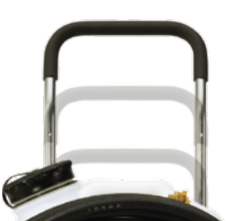
Teleskopgriff mit Softgrip